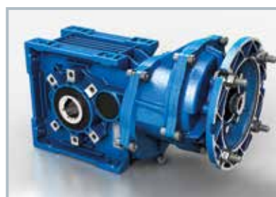
BA.. 3 Trenes Fijación patas/brida

Las diferentes versiones están disponibles con eje lento hueco. Eje lento solidario, simple o doble, disponible solo para el BA70.