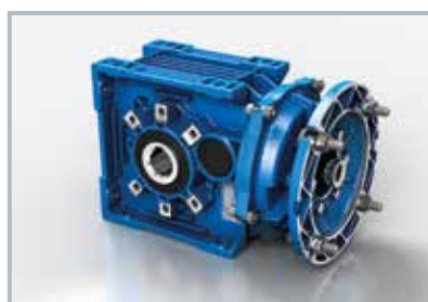
BA.. 2 Trenes Fijación patas/brida

Las diferentes versiones están disponibles con eje lento hueco, eje lento solidario simple o doble.