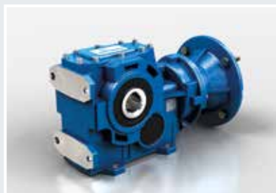
B... FC Fijación por patas