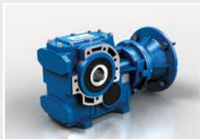
B... SC Fijación por brida